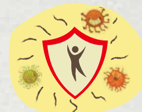
Điều trị phòng ngừa các bệnh nhiễm trùng