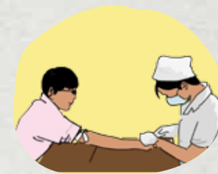
Điều trị cho người nhiễm HIV do tai nạn rủi ro