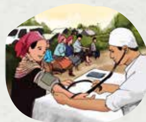
Điều trị các bệnh khác