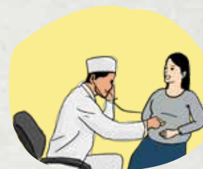
Xét nghiệm HIV cho phụ nữ mang thai