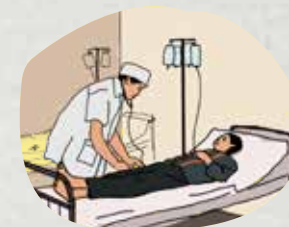
Nằm viện nội trú