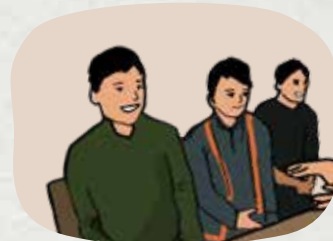
Suy nghĩ tích cực, vượt qua tâm lý mặc cảm, tự ti