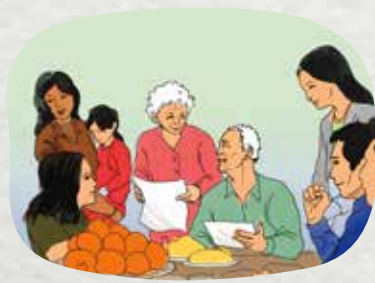
Gần gũi, động viên và hỗ trợ vật chất