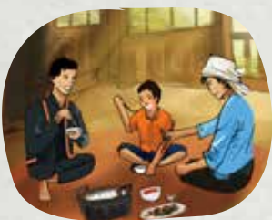
Ăn uống chung