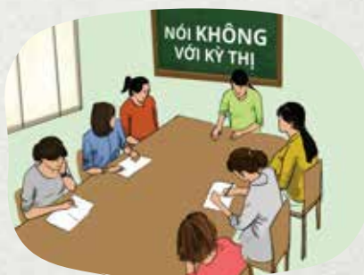
Thân thiện và chia sẻ với người nhiễm