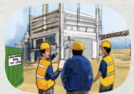
Gần gũi và tạo điều kiện cho người nhiễm làm việc

BỚT ĐI MỘT ÁNH MẮT KỶ THỊ LÀ TĂNG THÊM MỘT CƠ HỘI CHO NGƯỜI NHIỄM HIV!