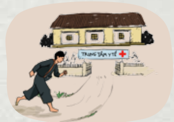
Chủ động đến bệnh viện hoặc cơ sở y tế gần nhất để được tư vấn điều trị HIV bằng thuốc ARV sớm