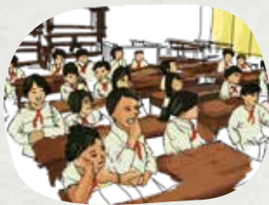
Cùng học tập và làm việc

Đã có thuốc điều trị cho người nhiễm HIV để họ có thể sống khỏe mạnh và làm việc