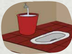
Dùng chung nhà vệ sinh