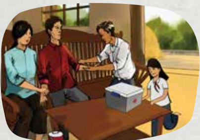
Cảm thông và hỗ trợ chăm sóc điều trị cho người nhiễm