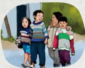
Bắt tay, khoác vai